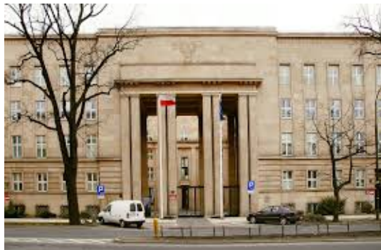
Budynek Ministerstwa Edukacji Narodowej