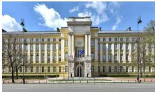
Urząd Rady Ministrów