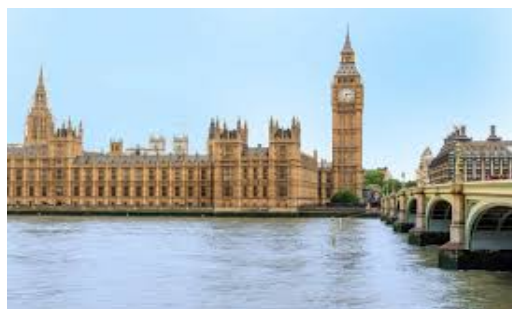
zegar Big Ben– Anglia;