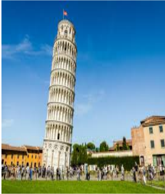
krzywa Wieża – Piza,