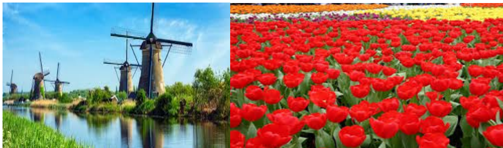
wiatraki, tulipany – Holandia;