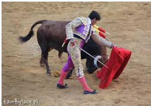
torreador, corrida – Hiszpania.

Układanie z rozsypanki nazw wybranych państw europejskich oraz nazwy kontynentu Europa .