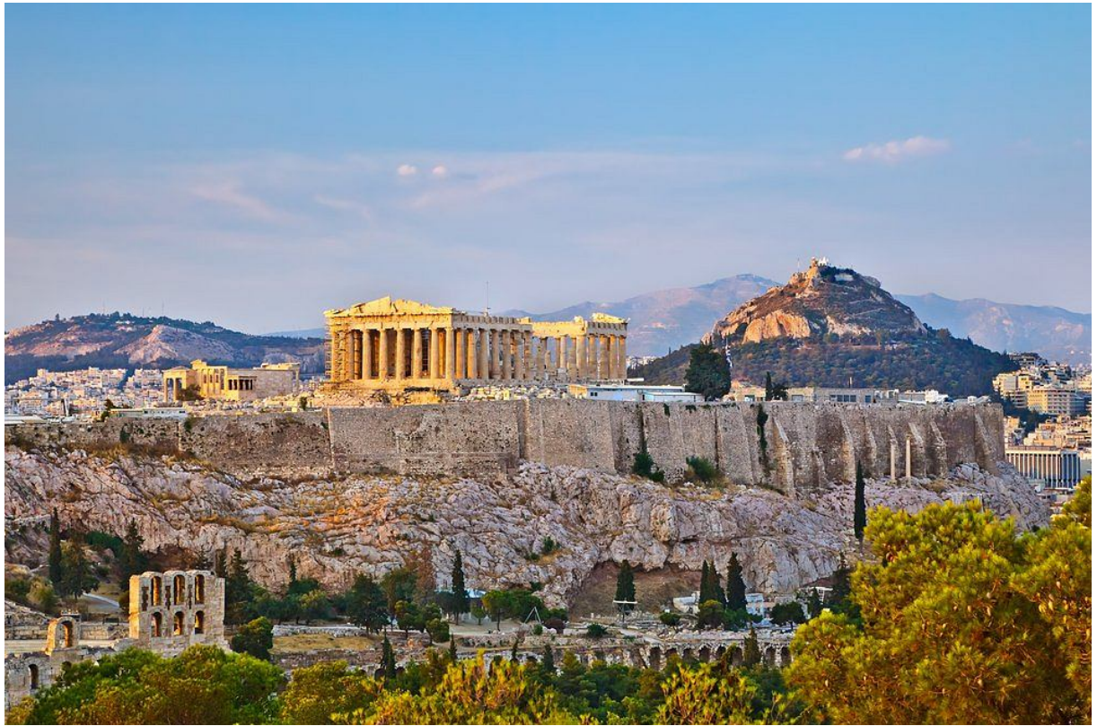
Akropol – Grecja;