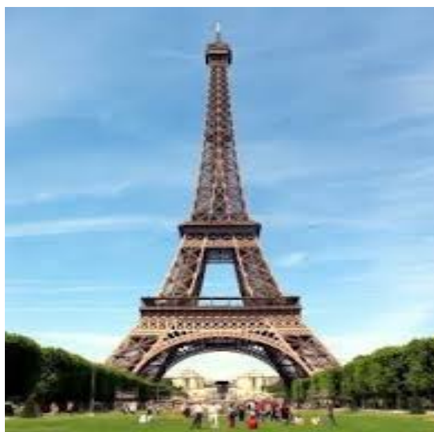
wieża Eiffla – Francja;

Oglądanie charakterystycznych dla nich budowli, symboli, np.: